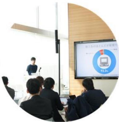
初期設定 無料ガイダンス