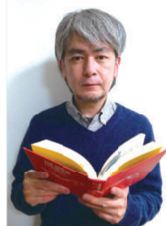
デザイン工学部 環境理工学科 准教授